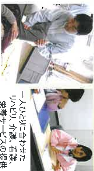
一人ひとりに合わせたリハビリ、介護、看護、栄養サービスの提供