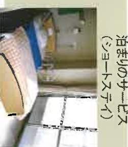
泊まりのサービス (ショートステイ)