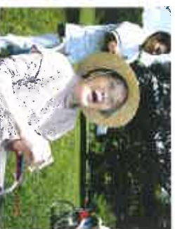
季節のお祭り風景