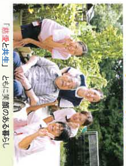
「慈愛と共生」ともに笑顔のある暮らし