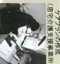
ケアプランの作成 (居宅介護支援事業所)