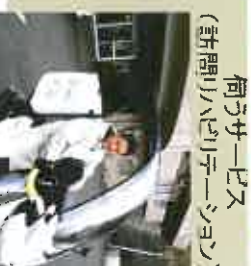
荷子サービス (訪問リハビリテーション)