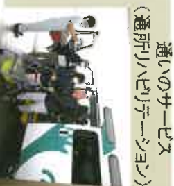
通いのサービス (通所リハビリテーション)